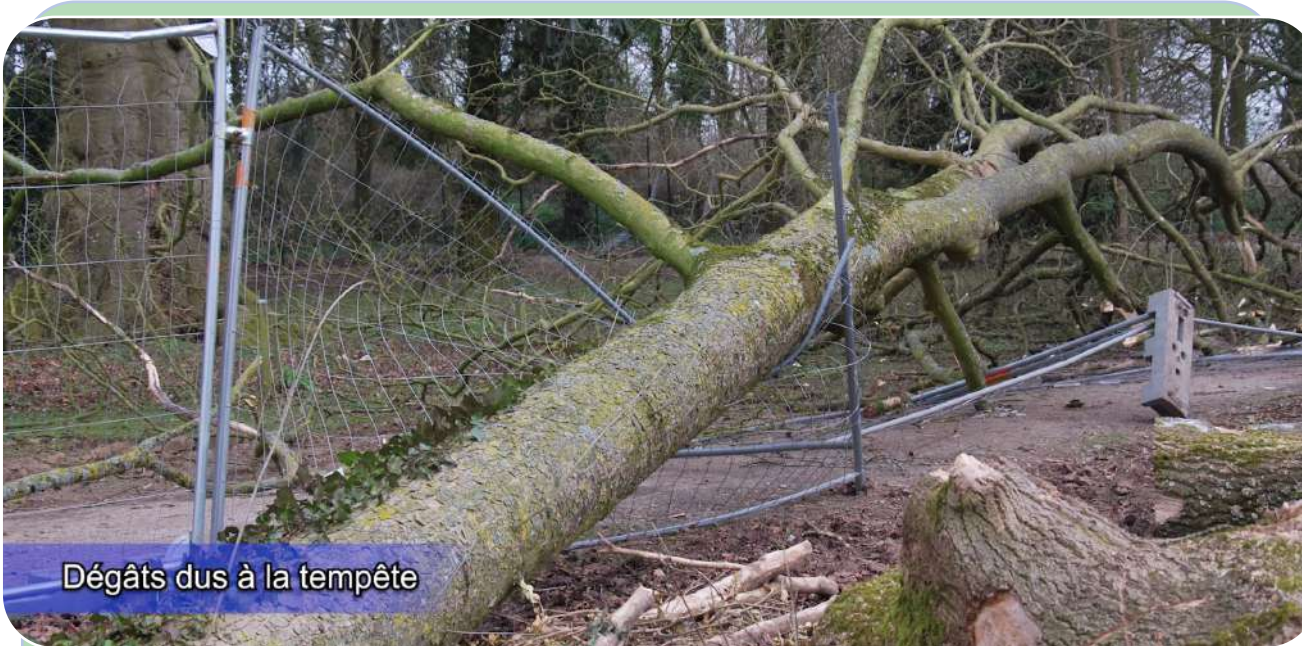
Dégâts dus à la tempête