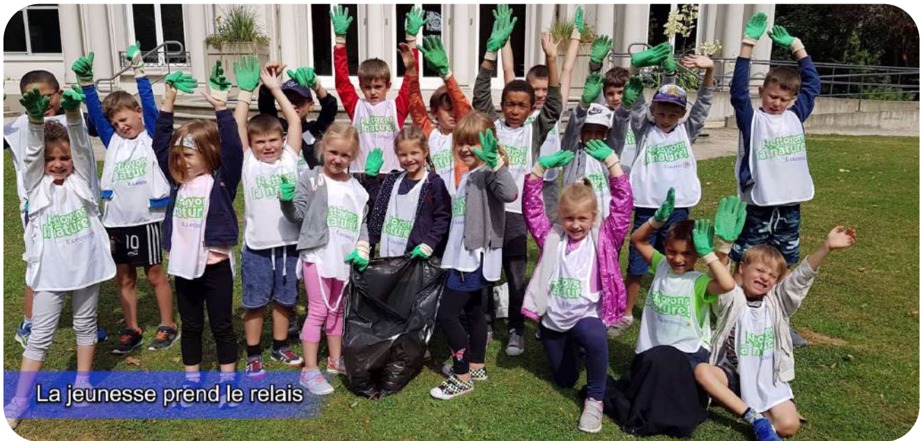
La jeunesse prend le relais