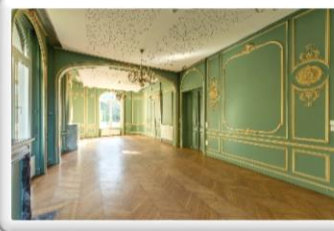
La salle d'Honneur